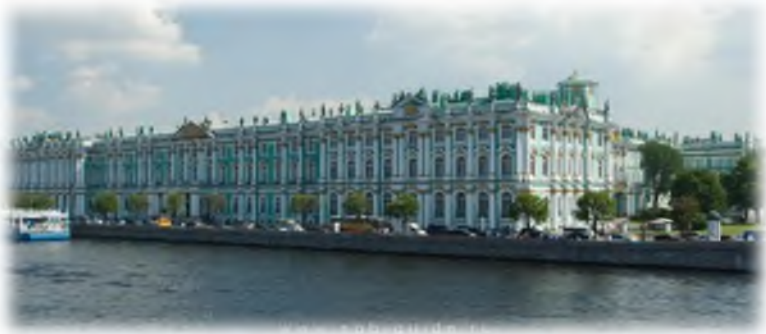
(фрагмент видеофильма о дворцах Санкт-Петербурга)