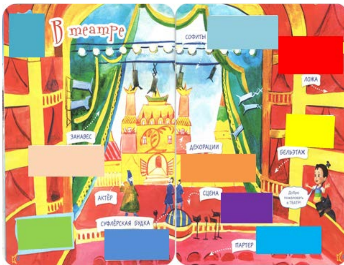
Схема зрительного зала