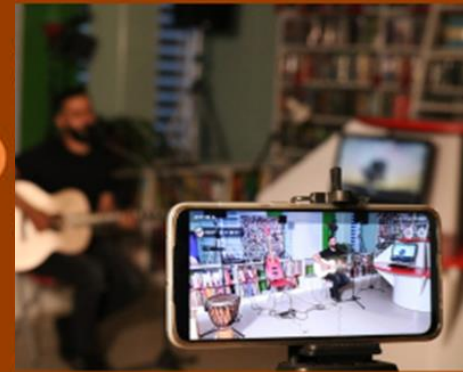
Библиотечники на пр. Строителей