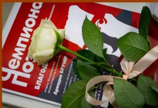
Чемпионат поэзии им. Маяковского

ВЛАДИМИРСКАЯ ОБЛАСТНАЯ БИБЛИОТЕКА ДЛЯ ДЕТЕЙ И МОЛОДЕЖИ