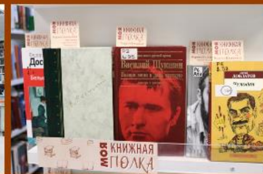
Моя книжная полка