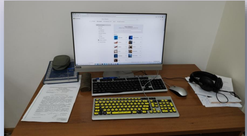
Компьютер, клавиатура со специальными наклейками, наушники, портативный цифровой увеличитель.