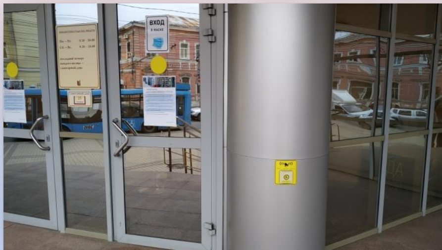
Кнопка вызова сотрудника