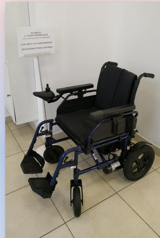
Коляска с электроприводом