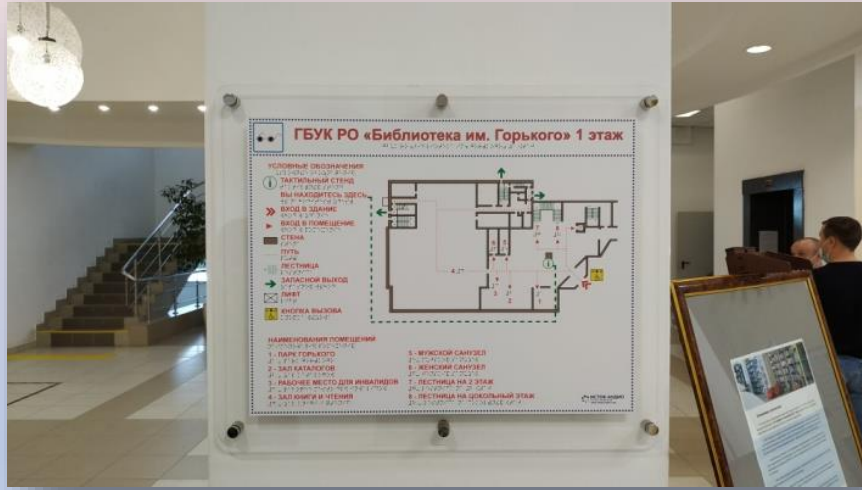
Схема расположения помещений с рельефным шрифтом Брайля